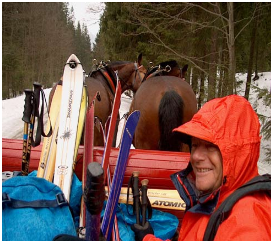
Ski de printemps dans les Tatras