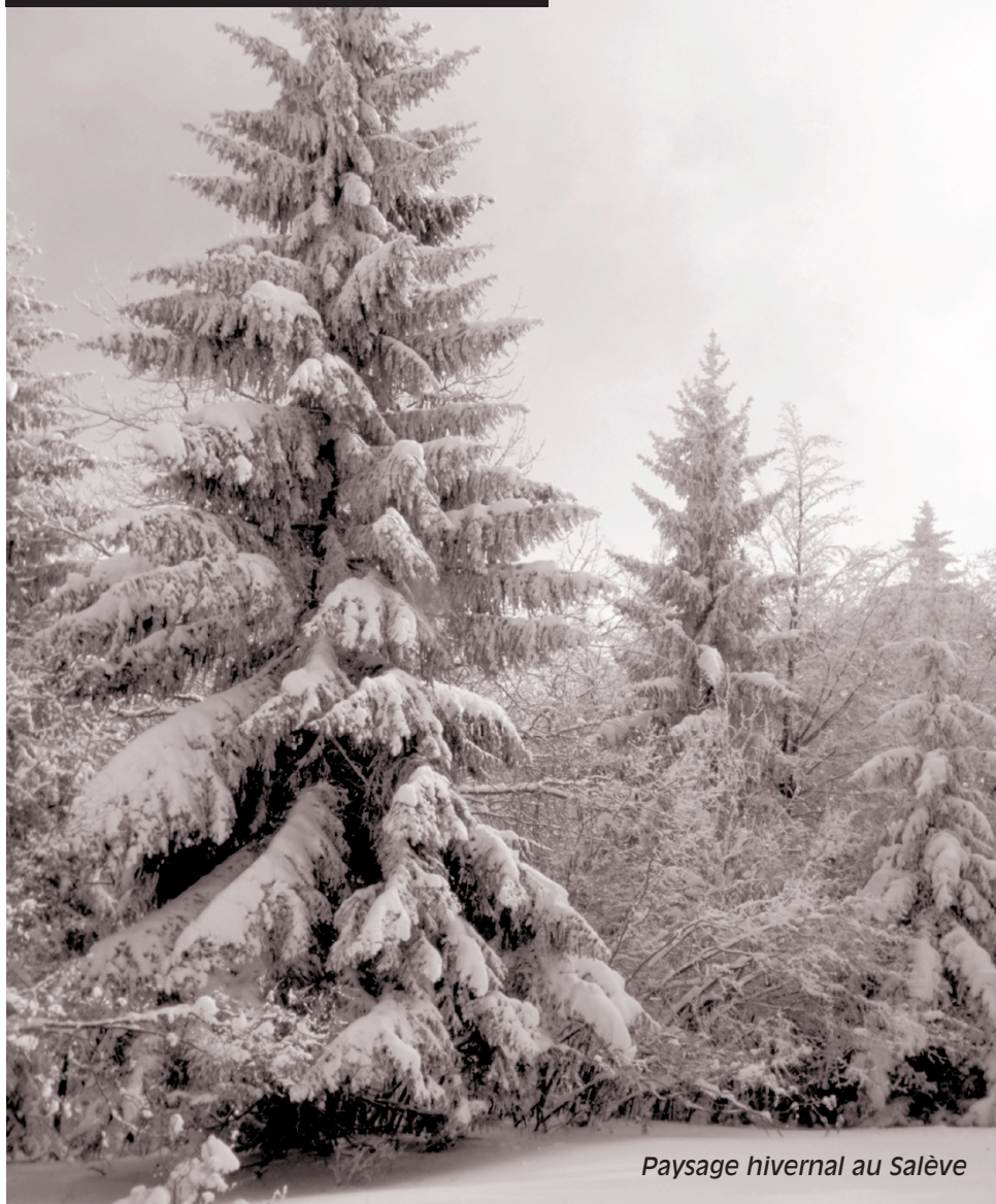
Paysage hivernal au Salève