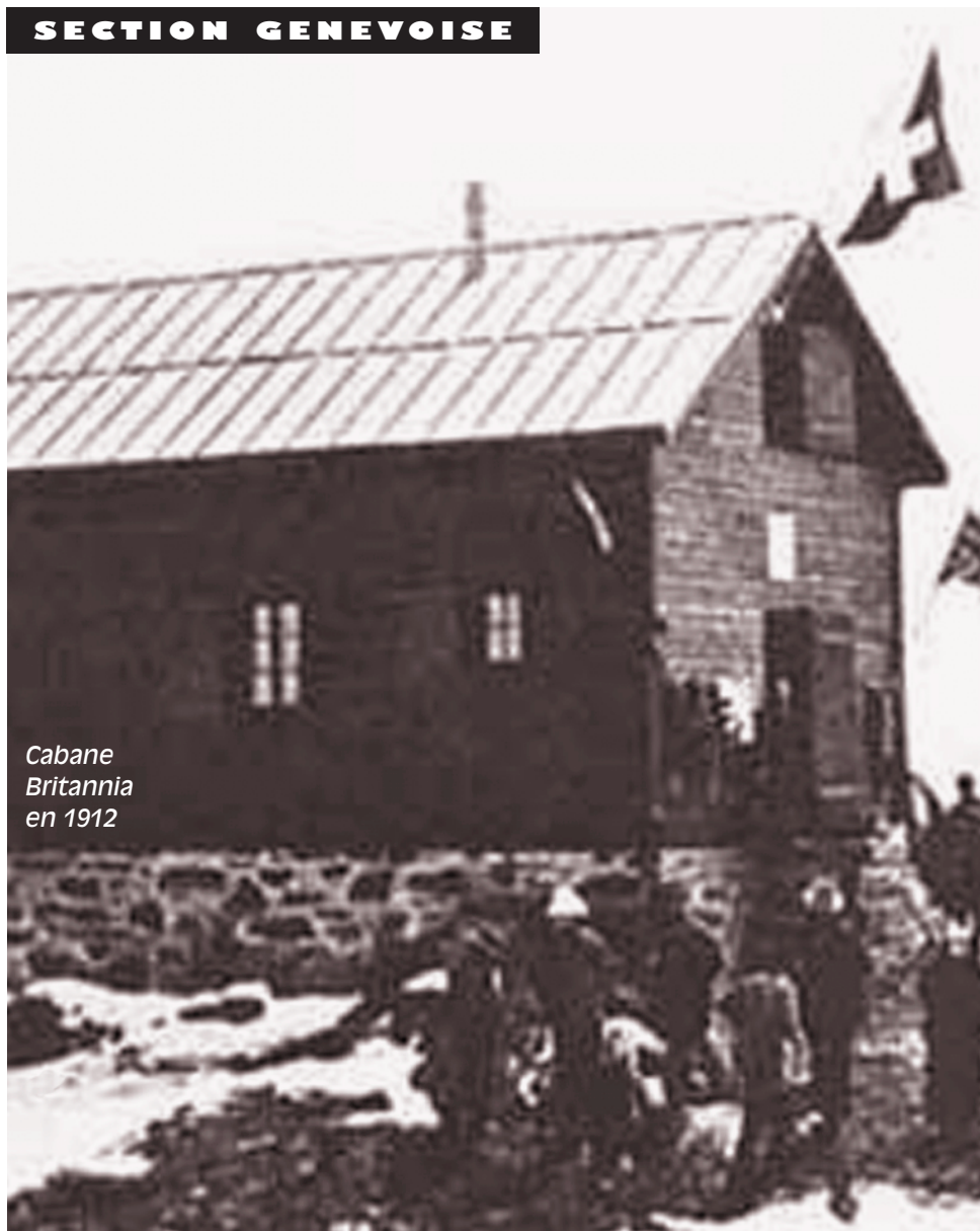
Cabane Britannia en 1912