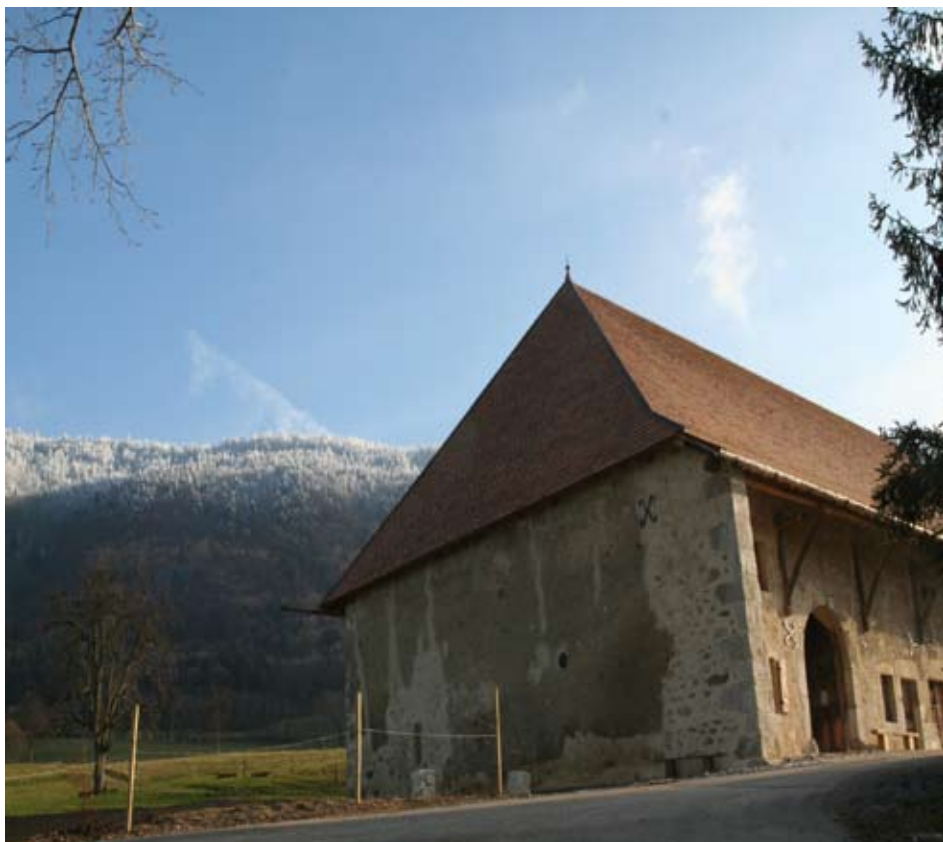
La maison du Salève