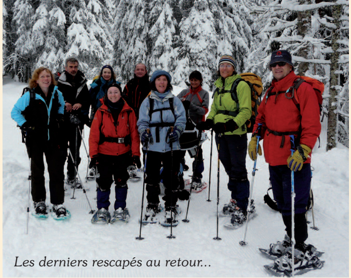
Les derniers rescapés au retour...