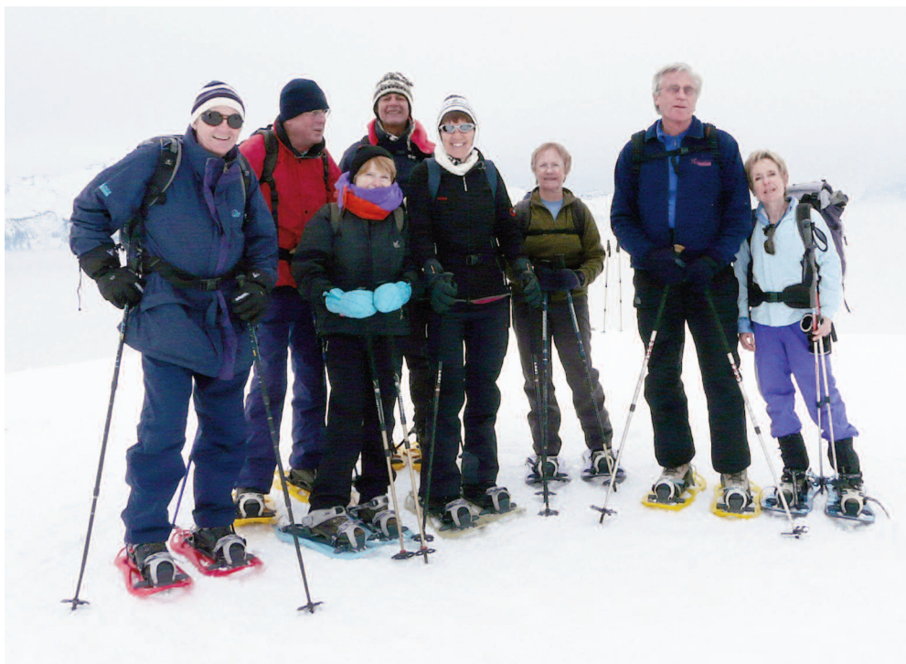
Le groupe des mardimixtes au sommet de La Bourgeoise le 6 janvier 2009

Réunion : le soir d'Assemblée à 18 heures.