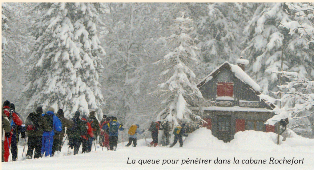
La queue pour pénétrer dans la cabane Rochefort