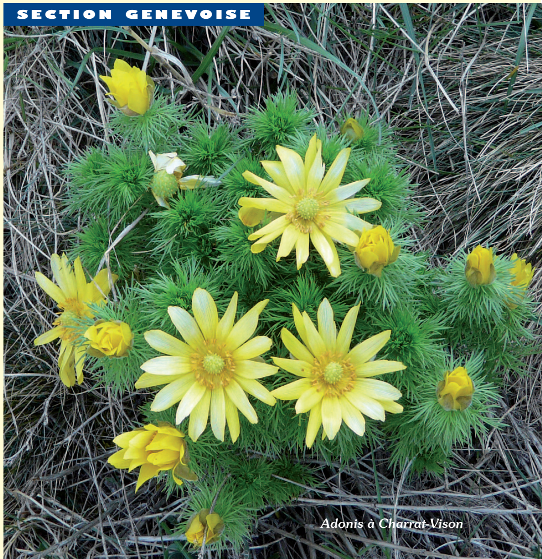
Adonis à Charrat-Vison