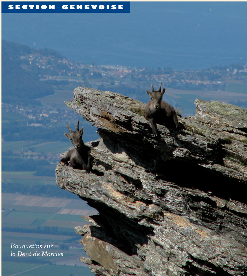
Bouquetins sur la Dent de Morcles