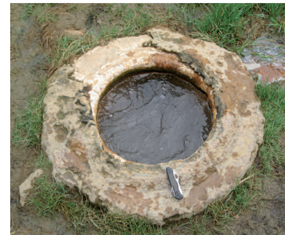
Débit de la source, 0,5 à 0,6 litre minute (Le couteau militaire de 11 cm donne l'échelle)

Du point de vue géologique, l'eau de pluie, au terme d'un voyage de quelques dizaines