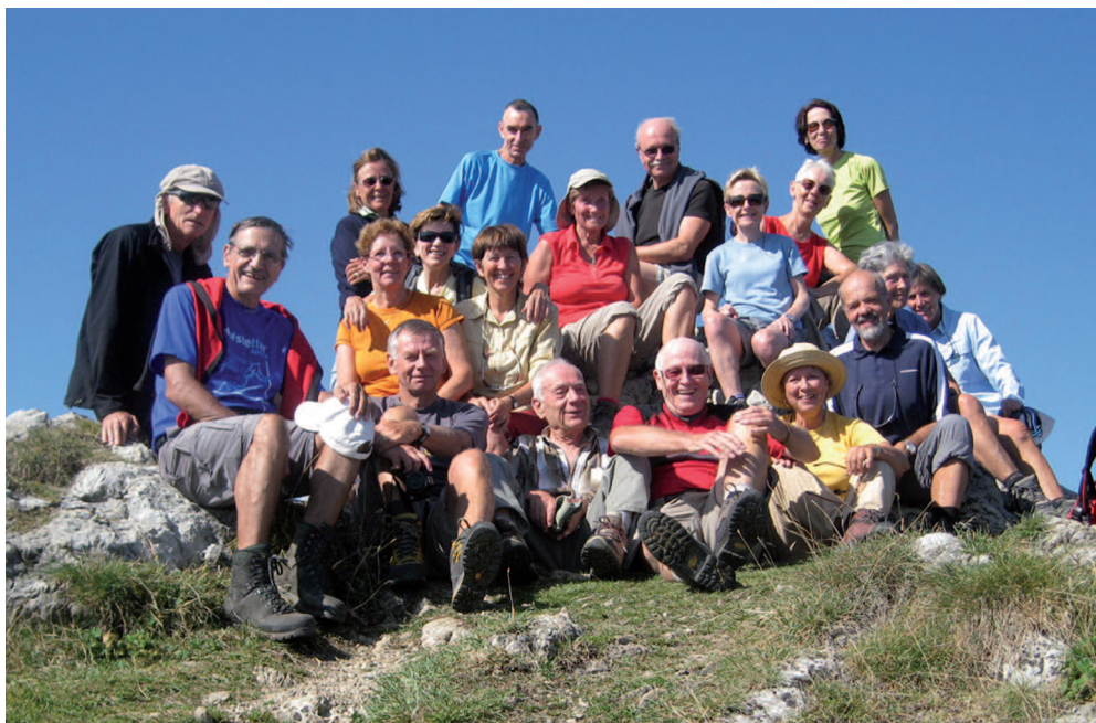
Mardimixtes à la Pointe Chalune le 8 septembre

Pour inscription, rendez-vous et transport veuillez vous adresser, s.v.p. à l'organisateur/trice respective, au plus tard le jour précédent à midi. Le déplacement en voiture privée est calculé sur la base de 50 cts le kilomètre et par voiture. Lors de chaque course, un franc par personne est perçu pour la caisse commune.