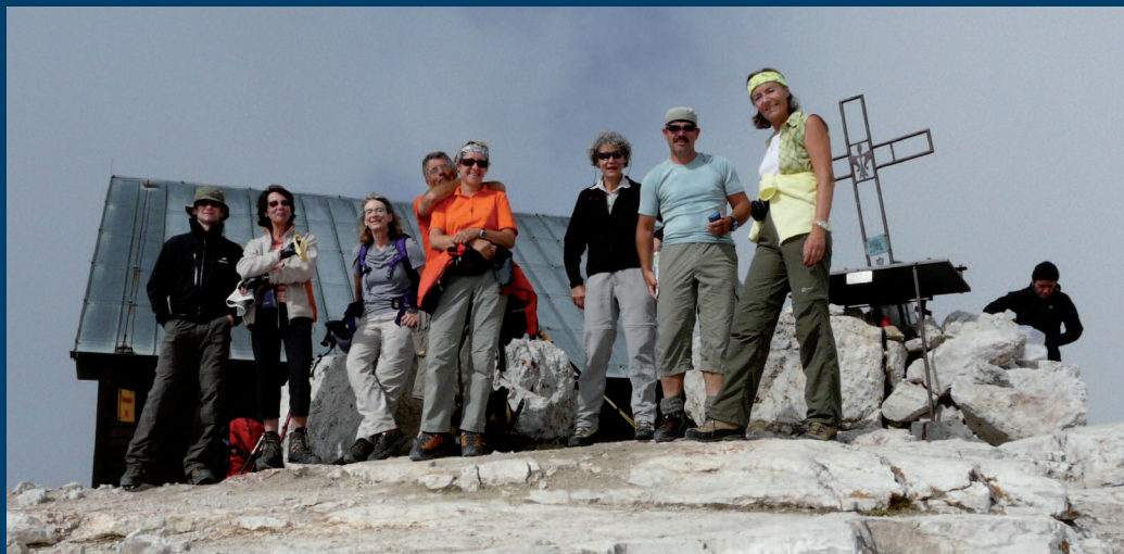
Au sommet du Piz Boè, 3152 m