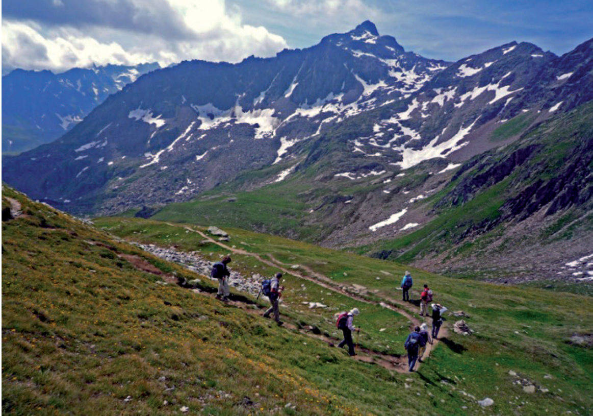
Descente du Piz Nurschals en direction du lac de Tuma, qui est la source du Rhin