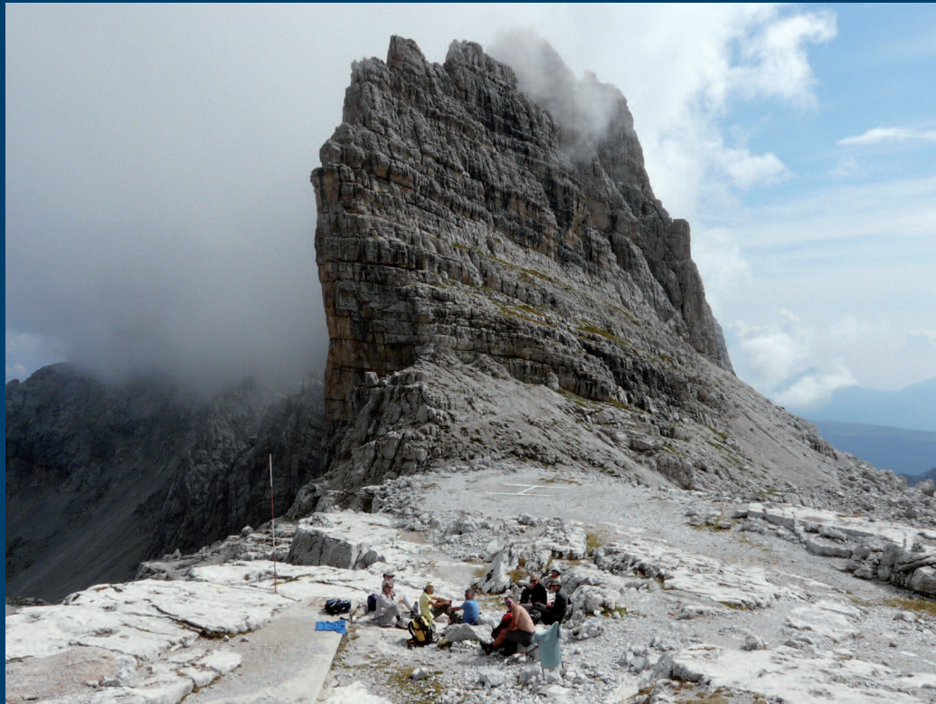
Pique-nique au refuge Tosa-Pedrotti, 2491 m