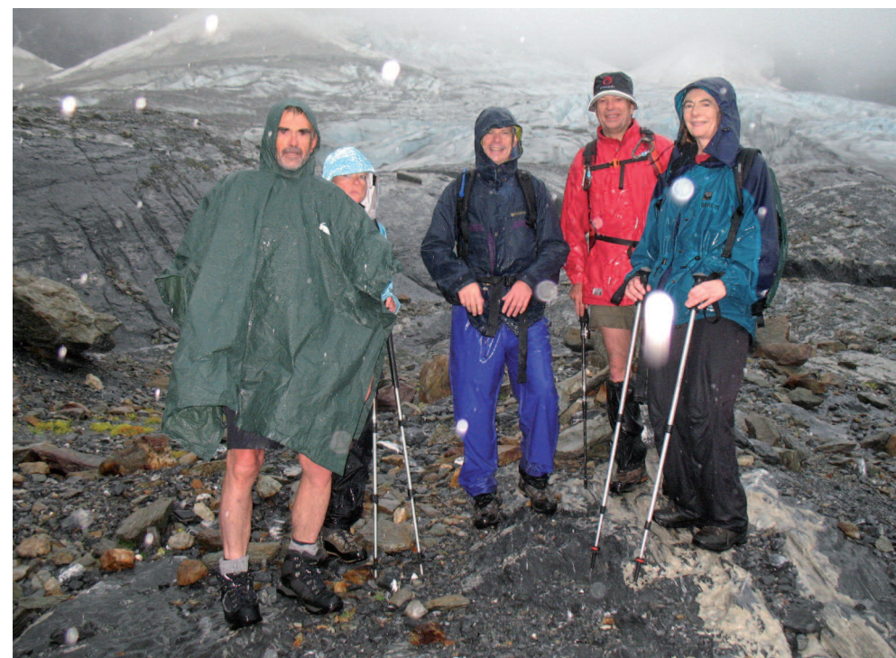
"Extra-terrestres au pied du glacier de Rosenlaur le 2 août"