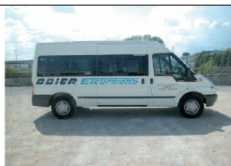
Minibus 15 places