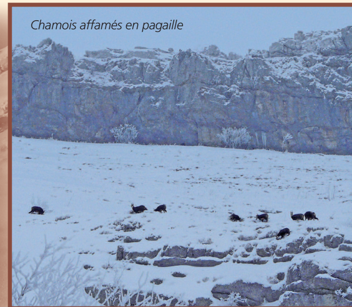
Chamois affamés en pagaille