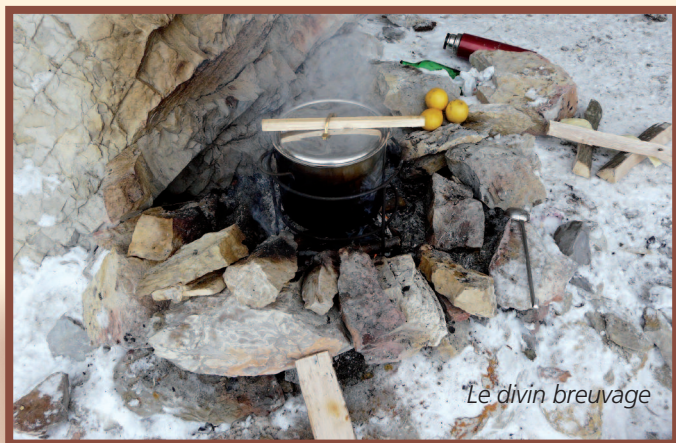
Le divin breuvage