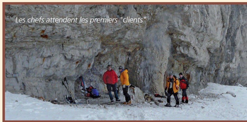
Les chefs attendent les premiers "clients"