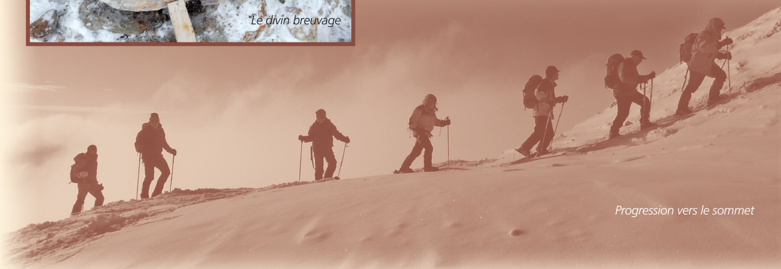
Progression vers le sommet