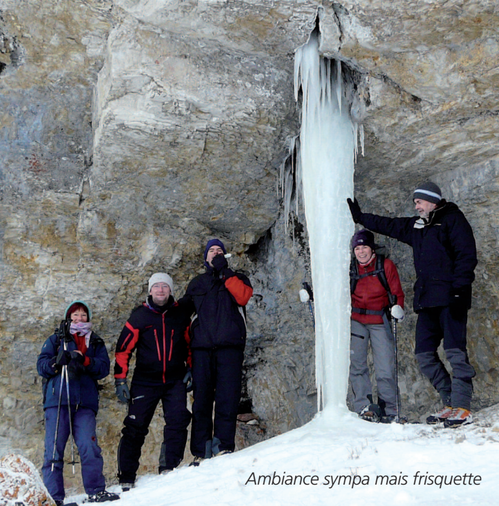
Ambiance sympa mais frisquette