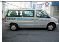
Limousines 7 places