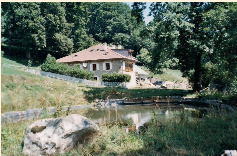
Vous voyez ci-dessus une propriété située non loin de notre cité. Elle a été acquise en l'an 1853 par une grande personnalité genevoise. Nous en parlerons dans notre prochaine contribution. En attendant, devinez le nom de cet endroit.

En Suisse, Lothar a été la plus grosse tempête jamais enregistrée, avec des pointes de vent à plus de 200 km/h. Elle a touché 20'000 ha de forêt. Le cubage tombé correspondait à l'équivalent de trois années de récolte de bois.