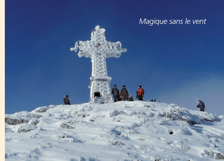
Magique sans le vent