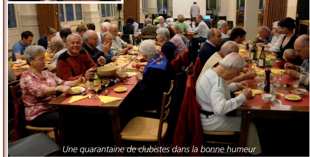
Une quarantaine de clubistes dans la bonne humeur