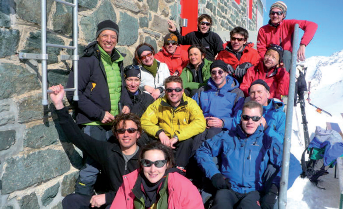
Les participants à la cabane Britannia