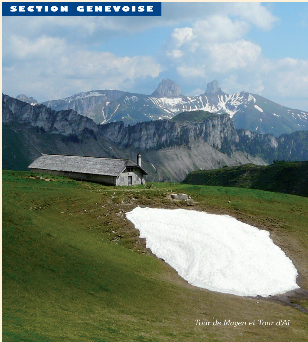
Tour de Mayen et Tour d'Aï