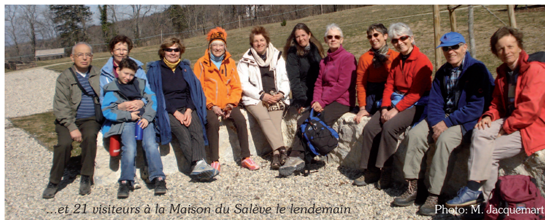
...et 21 visiteurs à la Maison du Salève le lendemain