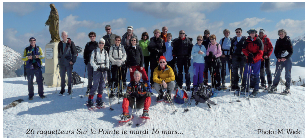
26 raquetteurs Sur la Pointe le mardi 16 mars...

Pour obtenir plus d'information les personnes intéressées peuvent consulter le site http://mardi-mixtes.cas-geneve.ch . Les personnes qui ne disposent pas d'internet peuvent contacter Sina Escher (Tél. 022 757 59 18), Hilke Maier (Tél. 022 349 00 82) ou Jean-Marie Schopfer (Tél. 022 757 36 58).