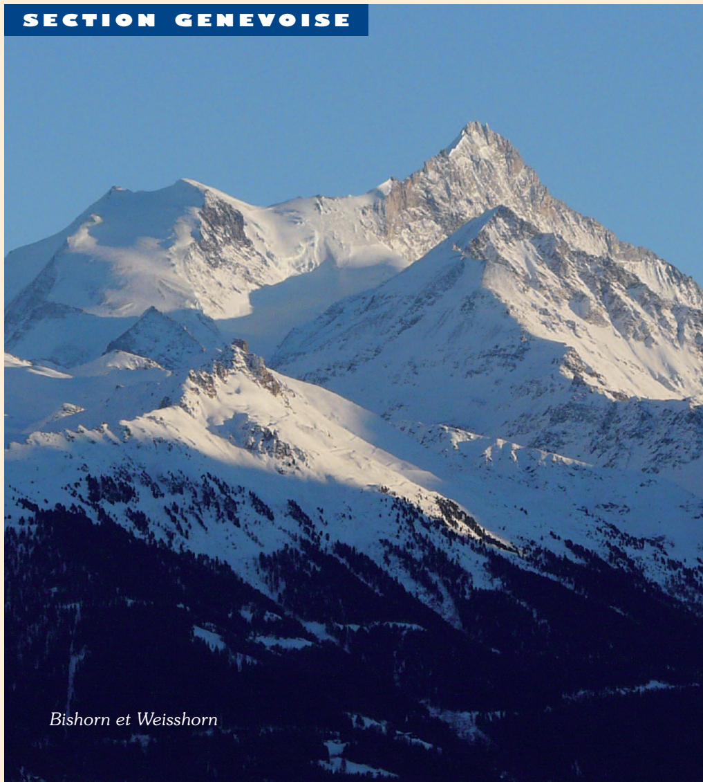
Bishorn et Weisshorn