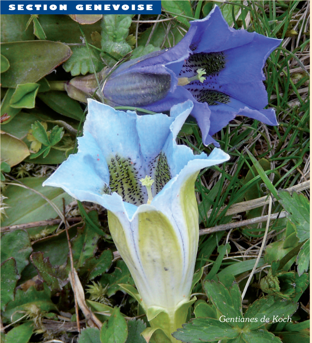
Gentianes de Koch