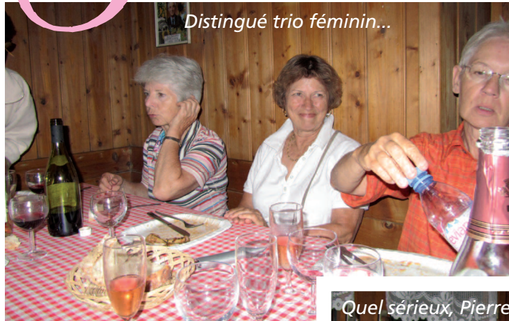
Distingué trio féminin...

(au propre et au figuré) à Pré-Berger le 22 juillet