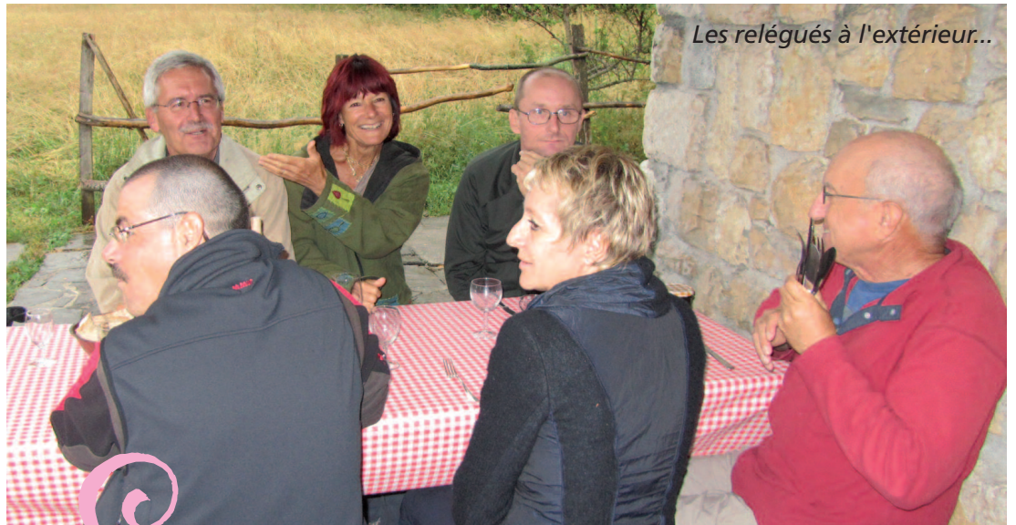
Les relégués à l'extérieur...