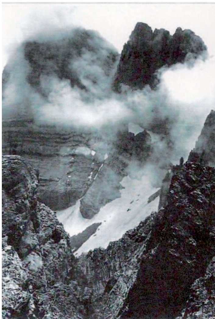
Le nom de cette montagne mythique? (non, ce n'est pas le Mont Gosse!) photographiée en 1917 par le membre le plus éminent de la dynastie qui a succédé à celle des Gosse sur le Mont. Une dynastie de photographes.

C'est en 1800 qu'il achète la colline portant les ruines du château féodal de Mornex. En raison de la situation politique changeante, il devra la racheter une seconde fois en 1802! A partir de 1811, ses séjours sur sa colline de Mornex s'allongent. Il y construit une maisonnette qu'il baptise Mon Bonheur . Sitôt arrivé, il revêt son habit de solitaire: une grande houppe et un bonnet à poil. Il distribue