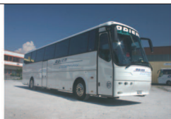
Autocar 24 à 54 places

Pierre Juillerat • téléphone 021 808 5991 • pierre.juillerat@bluewin.ch