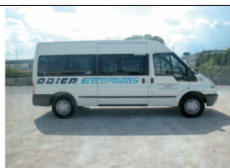
Minibus 15 places