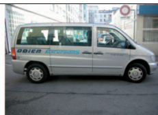
Limousines 7 places