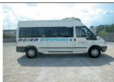
Minibus 15 places