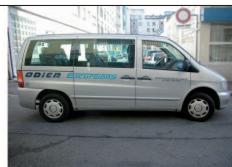
Limousines 7 places