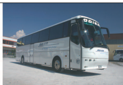
Autocar 24 à 54 places

Pierre Juillerat • téléphone 021 808 5991 • pierre.juillerat@bluewin.ch