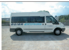
Minibus 15 places