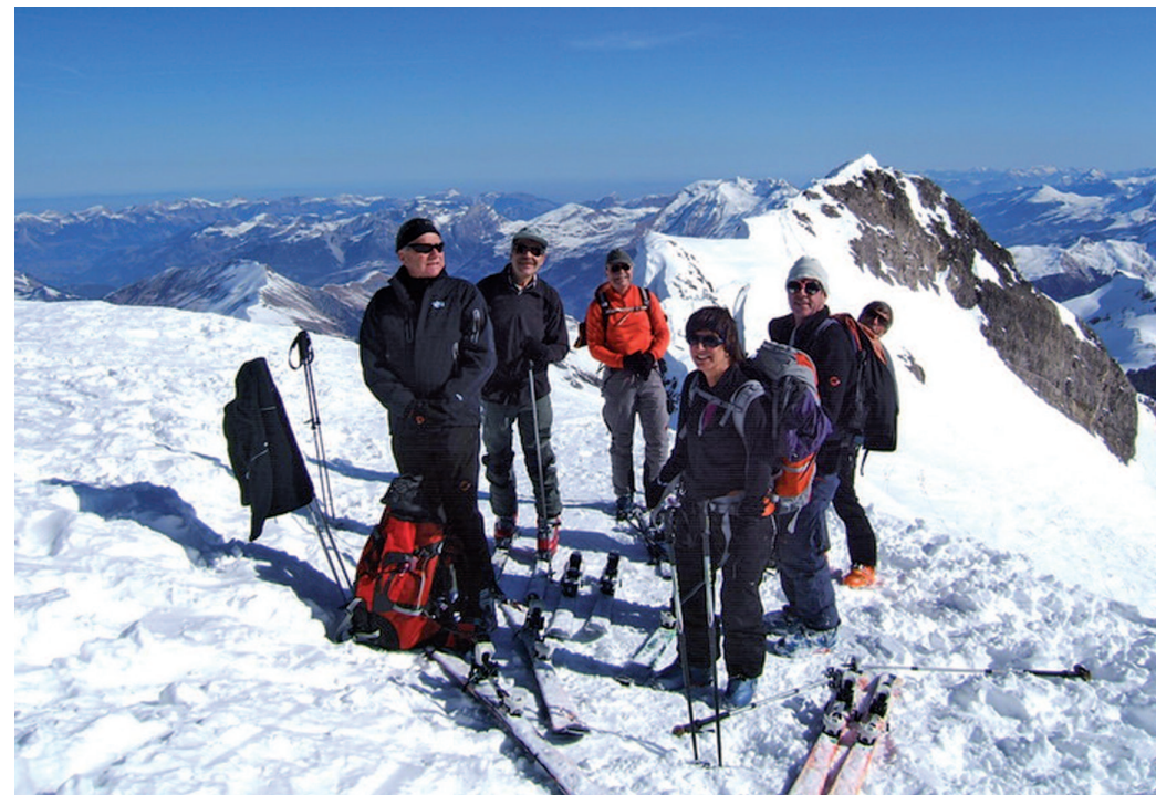
Skirando: 10 Mardimixtes au Wildhorn les 22-23 mars Course de Alain Gaille

Pour obtenir plus d'information, les personnes intéressées peuvent consulter le site http://www.cas-geneve.ch . Les personnes qui ne disposent pas d'internet peuvent contacter Sina Escher (Tél. 022 757 59 18), Hilke Maier (Tél. 022 349 00 82) ou Jean-Marie Schopfer (Tél. 022 757 36 58).