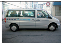
Limousines 7 places