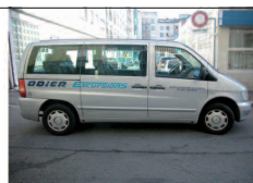
Limousines 7 places