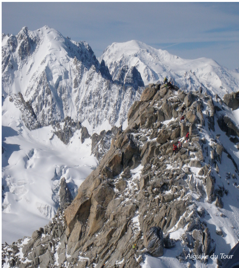
Aiguille du Tour

Bulletin mensuel de la Section Genevoise du Club Alpin Suisse • Paraît 12 fois par an