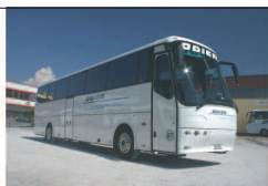
Autocar 24 à 54 places