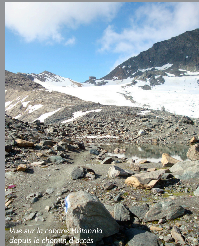
Vue sur la cabane Britannia depuis le chemin d'accès