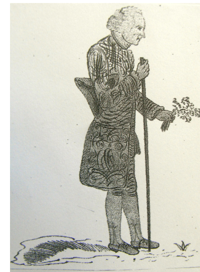
Rousseau herborisant (dessin anonyme)

Sources : citées dans la précédente contribution.