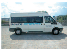
Minibus 15 places