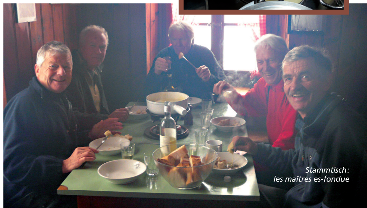
Stammtisch: les maîtres es-fondue