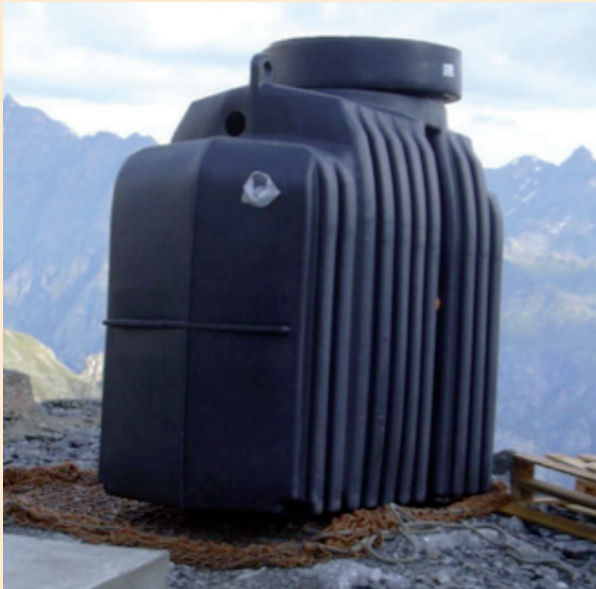
Installation d'épuration des eaux usées

Les anciens réservoirs ont été remplacés par une nouvelle installation: deux réservoirs de 5'000 litres chacun ont été placés à 30 m au-dessus de la cabane protégés du gel. La pression naturelle de l'eau fournit de l'eau courante à la cabane sans dispositif particulier. Les chauffe-eau nécessitent une plus forte pression qui est obtenue à l'aide d'un suppresseur.