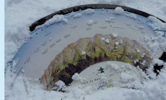
Tête du Daney (MW)

A moins qu'on les munisse de DVA en mode "émission" !