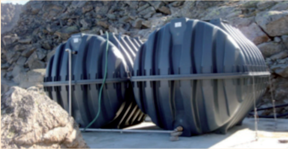
Réservoirs d'eau: 2 x 5000 litres

Le glacier de Ried se retire progressivement et la conduite doit être rallongée en conséquence. Actuellement sa longueur couvre 2 kilomètres! C'est un dispositif considérable pour approvisionner une cabane du CAS en eau.