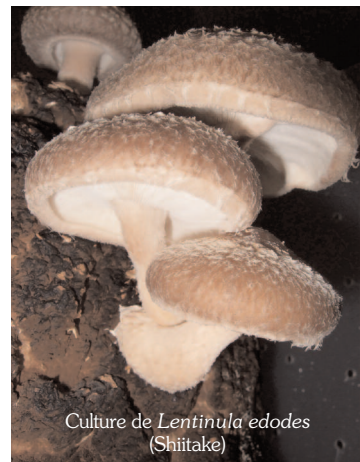
Culture de Lentinula edodes (Shiitake)

On comprend donc pourquoi il est difficile d'envisager la culture de la plupart des champignons (mycorhiziques), étroitement associés à un hôte déterminé. C'est le cas de la plupart des bolets, et aussi la truffe, dont on ne peut que favoriser le développement en plantant des chênes truffiers.