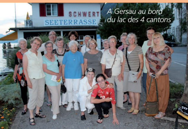
A Gersau au bord du lac des 4 cantons