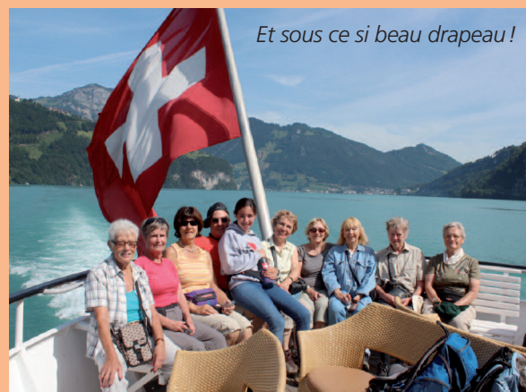
Et sous ce si beau drapeau!