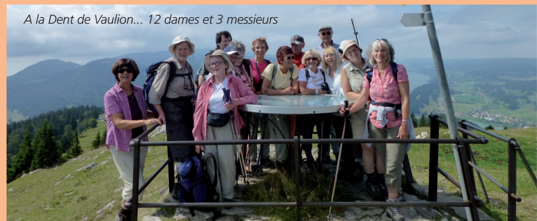
A la Dent de Vaulion... 12 dames et 3 messieurs

Nous achevons déjà notre première saison de randonnée sous notre nouvelle appellation: Jeudimixtes - et non plus "Groupe féminin" !