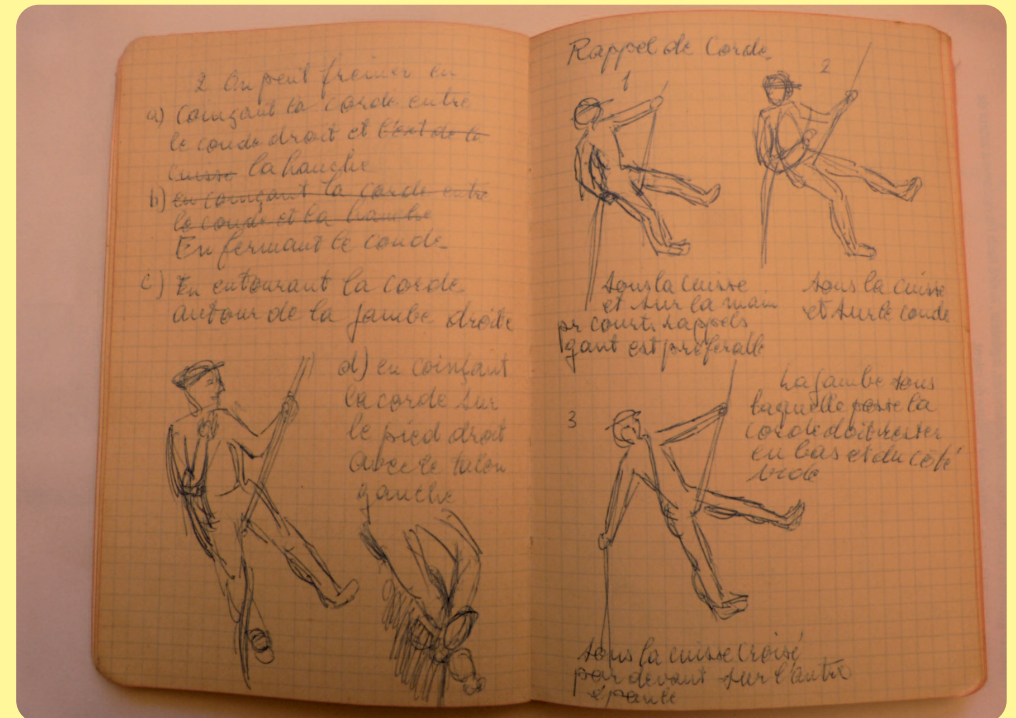
Extraits du carnet d'André Roch à propos des rappels à l'époque

M. Wicki