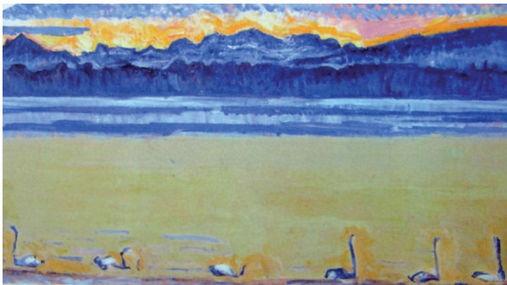
La rade de Genève et le Mont-Blanc, avec cygnes, 1918. MAH, Genève

Jeune homme, il entreprend un apprentissage de peintre de vues touristiques (védutiste), activité alors fort rémunératrice depuis la seconde moitié du 18 e siècle. En 1871, il se rend à Genève à pied, quelques sous en poche pour apprendre le métier en copiant des tableaux de Diday et Calame. Il a la chance de rencontrer le peintre Barthélémy Menn qui l'accepte dans sa classe et va l'aider à affirmer sa personnalité. Il y restera 6 ans et dira « Je dois tout à Menn ». En 1885, après une crise de conscience qui le conduit dans la voie du symbolisme, il est par-