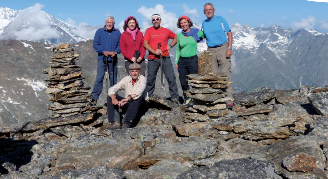
Siamaises entourées de quatre CdC au sommet du Kl. Bigerhorn