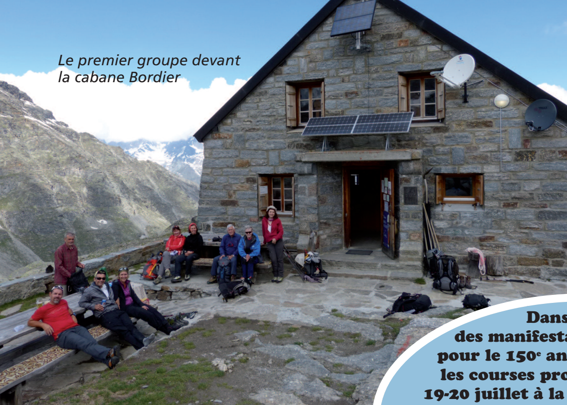
Le premier groupe devant la cabane Bordier