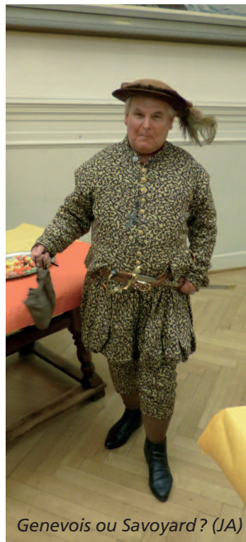
Genevois ou Savoyard? (JA)

MW (photos de J. Auroy, Y. Coeckelbergs et M. Wicki)