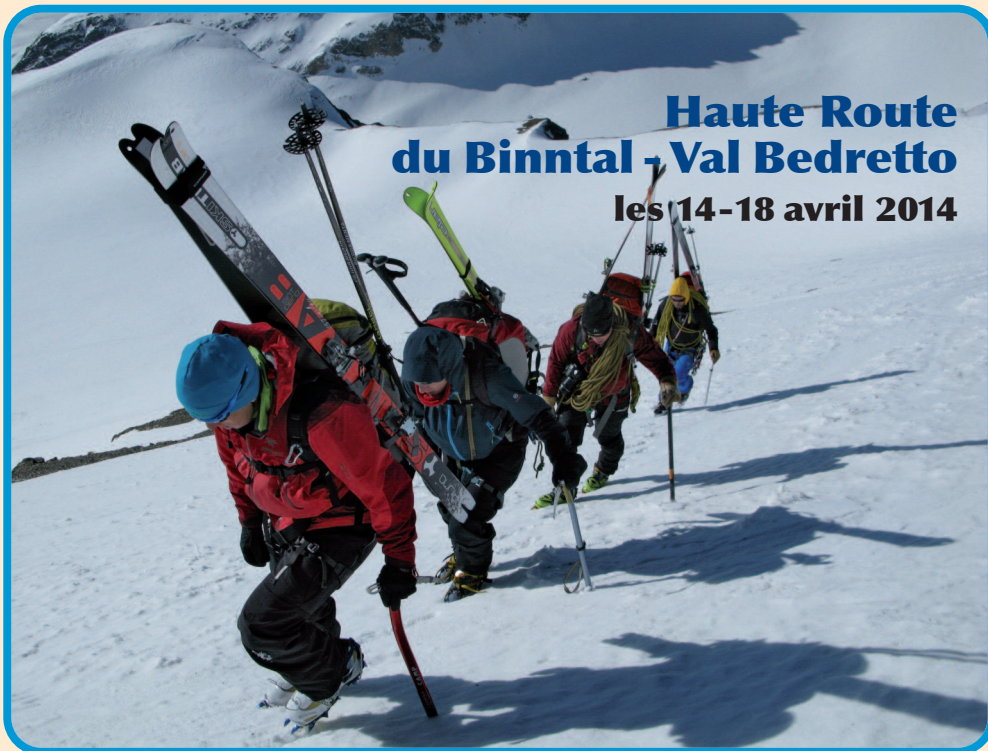
Courses et photos de Cédric Heeb