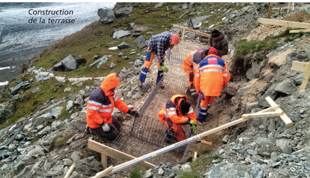
Construction de la terrasse

Cette magnifique terrasse est maintenant prête à recevoir ses nouveaux visiteurs. La Commission des cabanes de la section genevoise tient encore à remercier très vivement