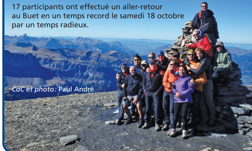
CdC et photo: Paul André

17 participants ont effectué un aller-retour au Buet en un temps record le samedi 18 octobre par un temps radieux.