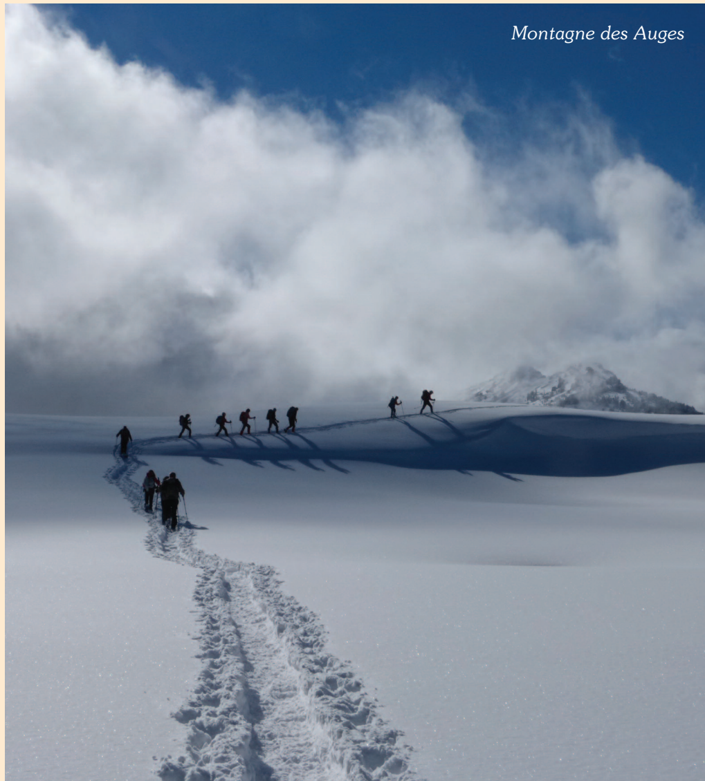
Montagne des Auges

Bulletin mensuel de la Section Genevoise du Club Alpin Suisse • Paraît 12 fois par an