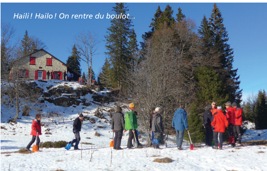
Haili! Hailo! On rentre du boulot...