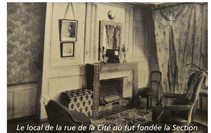
Le local de la rue de la Cité où fut fondée la Section

Une deuxième raison a pu retarder le zèle des Genevois. En effet, le contexte politique local est parfois tendu, comme le montrent les échauffourées violentes avec plusieurs morts lors d'une élection complémentaire au Conseil d'État le 22 août 1864. C'était trois semaines avant les festivités du 50 e anniversaire de l'entrée de Genève dans la Confédération qui furent naturellement différées. Curieusement aussi, le soir du même 22 août, c'est à l'Hôtel-de-Ville à peine vidé de ses émeutiers que les représentants d'une douzaine de pays européens signaient la première « Convention de Genève ». Le général Dufour, l'un de nos membres fondateurs, a présidé les travaux de la Conférence préparatoire et joué un rôle essentiel dans la rédaction de la Convention, considérée comme l'acte fondateur du droit humanitaire international. F. + A.-M. Walter