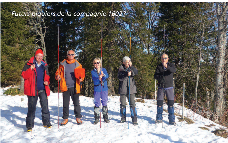
Futurs piquiers de la compagnie 1602?