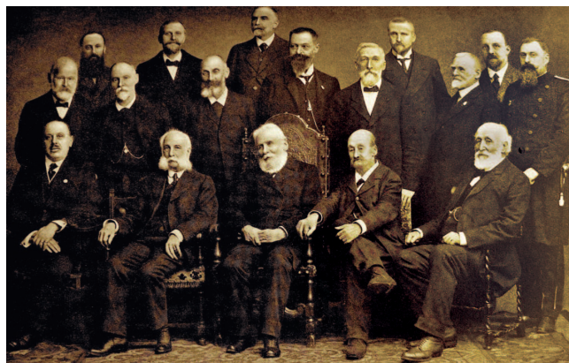
Ces messieurs de La Genevoise en 1915

À la Genevoise, 150 1865 2015 il y a 150 ans... Club Alpin Suisse Section Genevoise