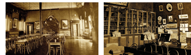
Le local à la rue du Mont-Blanc en 1915

Les conférenciers dissertent sur les types de souliers de montagne ou les mérites des alpenstocks en bambou; d'autres parlent du statut des guides et des dangers des Alpes; les plus savants expliquent les phénomènes électriques en altitude; déjà le changement climatique et le retrait des glaciers préoccupent, ou encore la question de savoir comment les glaciers rigides peuvent s'écouler comme un fleuve et pourquoi des couches calcaires se trouvent à très haute altitude par dessus des terrains cristallins. Enfin des membres de la Section font part de leurs expériences quant à la portée des armes à feu en altitude ou les effets des morsures de vipère. Certains reviennent aussi sur les grandes catastrophes comme la vidange du lac glaciaire du Giétroz en 1818. La dent de mammoth trouvée en 1878 au Bois de la Bâtie ranime aussi les fantasmes préhistoriques.