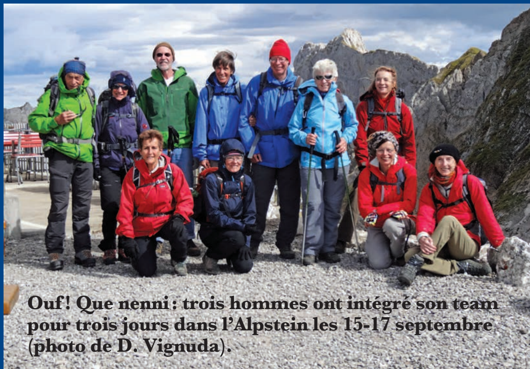
Ouf! Que nenni: trois hommes ont intégré son team pour trois jours dans l'Alpstein les 15-17 septembre.