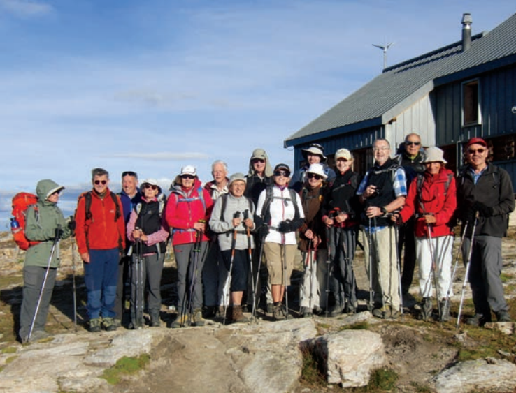
A la Cabane des Becs de Bosson