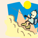
Terrasses de Lavaux

Reprise des courses des Jeudimixtes le 7 janvier 2016