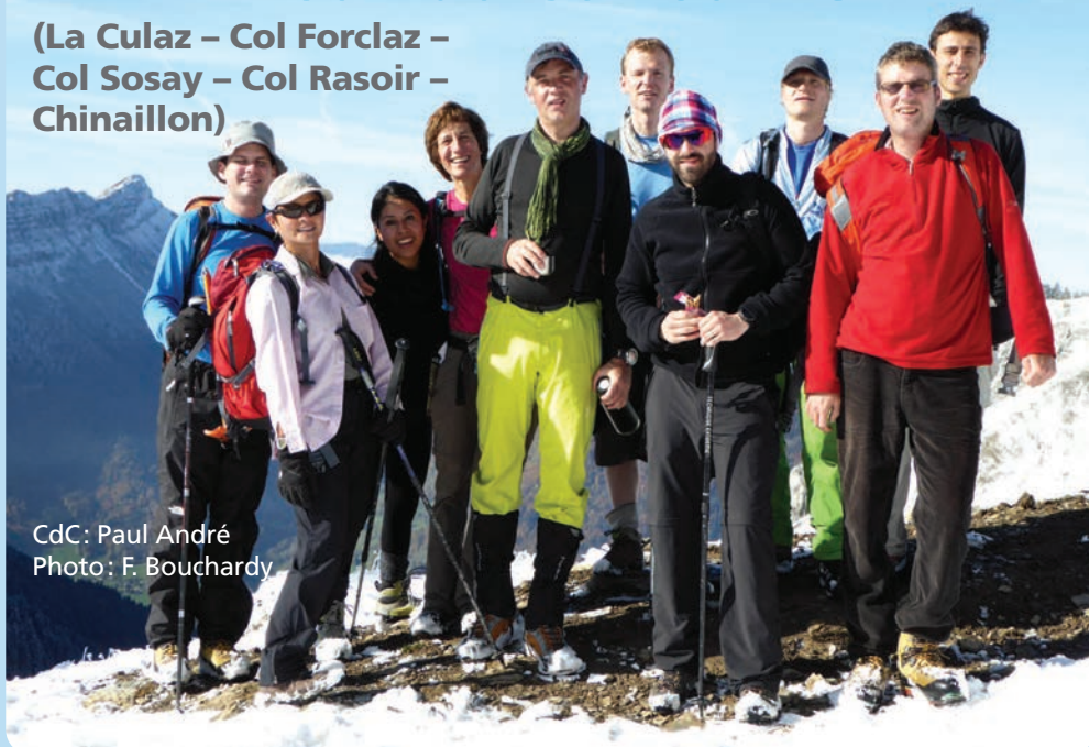
CdC: Paul André

(La Culaz – Col Forclaz – Col Sosay – Col Rasoir – Chinailon)