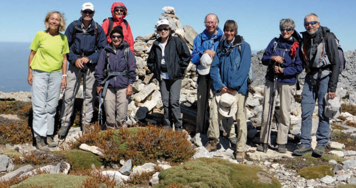
Montagnes Blanches, Ghighilos 2008 m