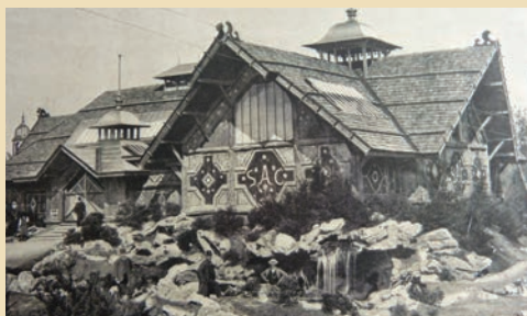
Le pavillon du C.A.S. à l'exposition nationale de Genève (1896)

Le pavillon du C.A.S. est conçu par des membres de la Section. Sur 460 mètres carrés, le bâtiment à pignons couvert de bardeaux relève bien du kitch alpestre. Entouré d'une rocaille avec des pins et des rhododendrons, il est un véritable condensé de la nature alpine orchestré par le paysagiste Henry Correvon, un futur président. À l'intérieur, le visiteur passe des animaux empaillés aux costumes paysans et aux ustensiles de chalet d'alpage. Un assemblage de la carte Dufour rend visible la patrie suisse en miniaturisation.