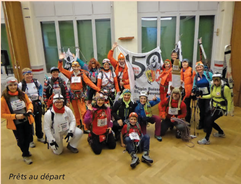
Prêts au départ