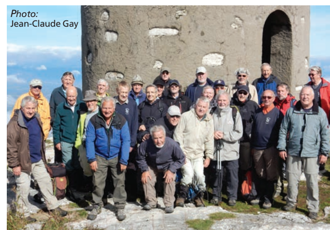
Les Jeudistes A & B au Grand Piton le 8 octobre.

service à gogo, a été très apprécié autant pour la qualité de la cuisine que pour son prix imbattable!