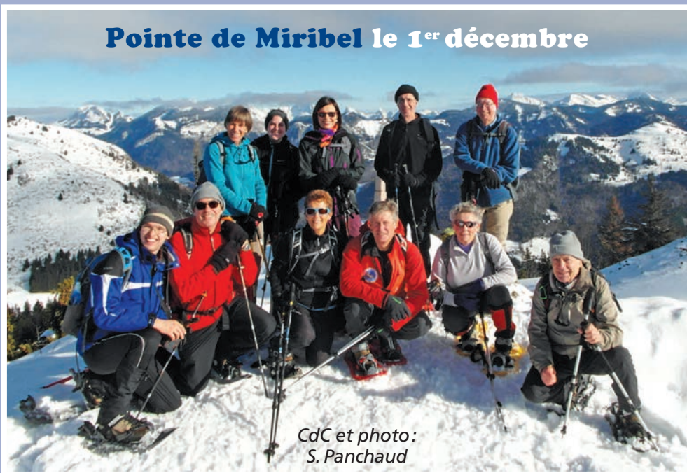
CdC et photo: S. Panchaud