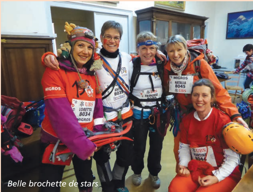
Belle brochette de stars