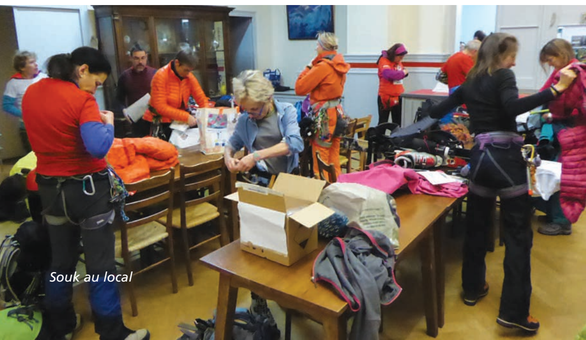
Souk au local