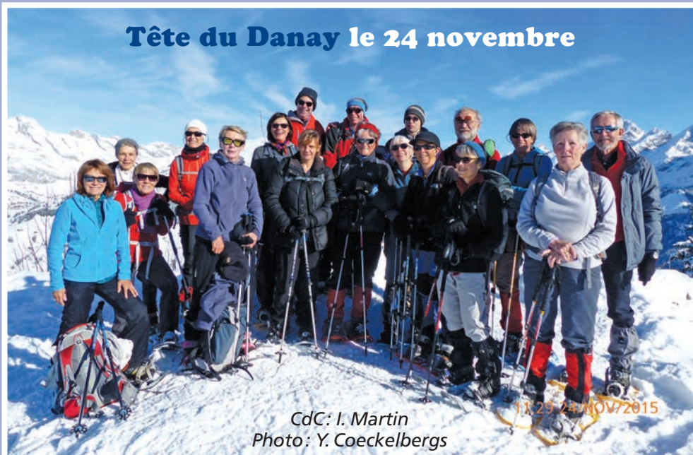
CdC: I. Martin