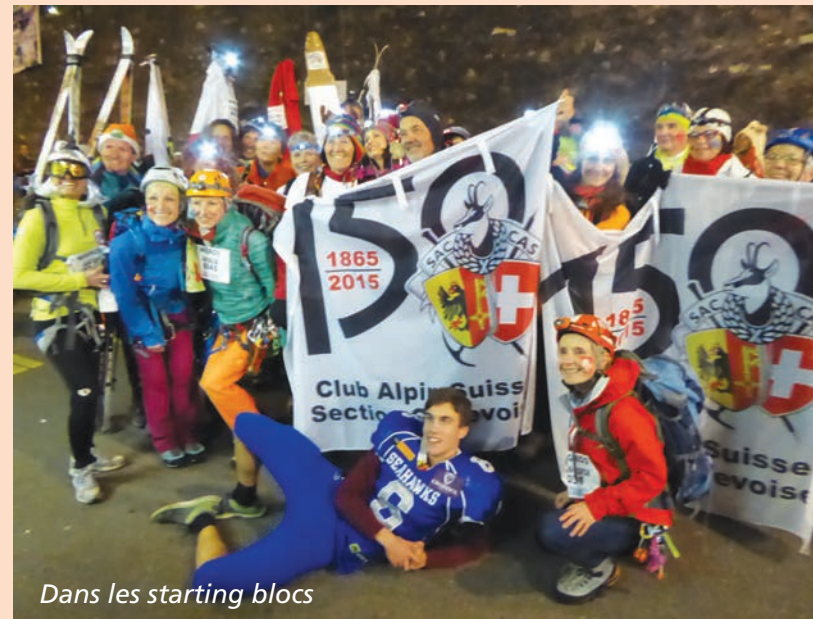
Dans les starting blocs

Traditionnellement, le repas annuel de la section correspond avec l'Escalade. L'occasion de festoyer et briser la non moins traditionnelle marmite géante. La soirée de gala du 150 e organisée le 31 octobre allait-elle nous priver de la fête populaire la plus appréciée des Genevois? Que nenni!