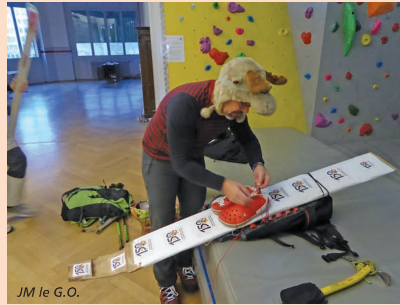
JM le G.O.