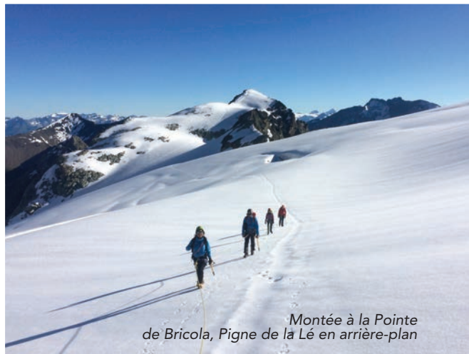
Montée à la Pointe de Bricola, Pigne de la Lé en arrière-plan