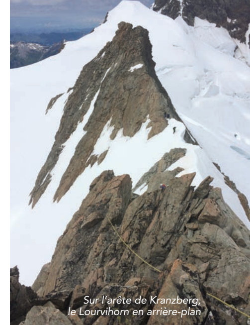
Sur l'arête de Kranzberg, le Lourvihorn en arrière-plan

Une sympathique équipe à 6 se retrouve pour des péripéties dans l'Oberland Bernois... Après une première journée magnifique ponctuée par deux sommets (Lourvihorn, 3777 m et Kranzberg, 3742 m), la météo tourne malheureusement comme