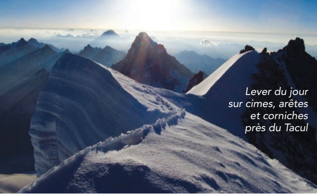
Lever du jour sur cimes, arêtes et corniches près du Tacul