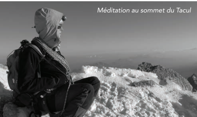
Méditation au sommet du Tacul