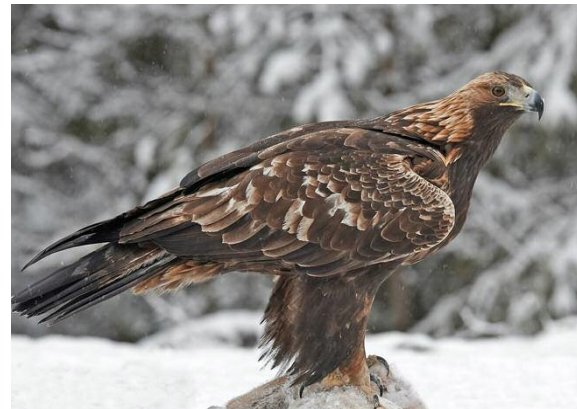
Gypaète barbu ( Gypaetus barbatus )