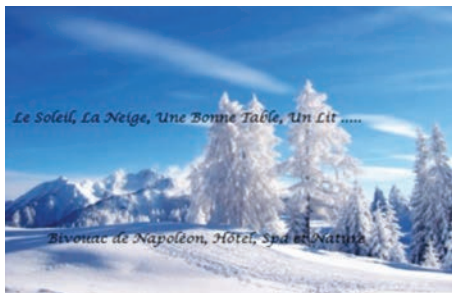
Le Soleil, La Neige, Une Bonne Table, Un Lit .....