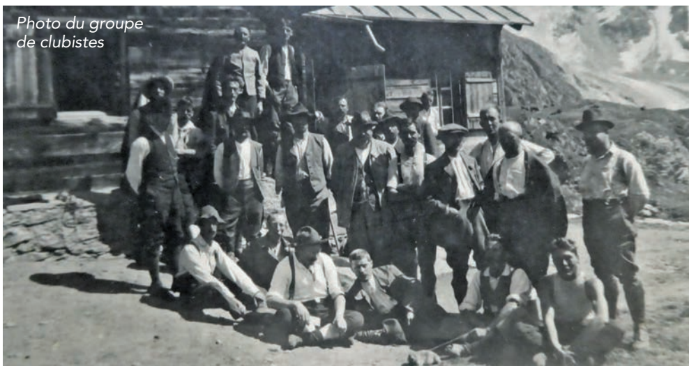
Photo du groupe de clubistes

Lors de vos randonnées, faites attention et restez sur les chemins balisés!