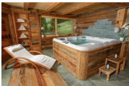
Bivouac de Napoléon, Hôtel, Spa et Nature