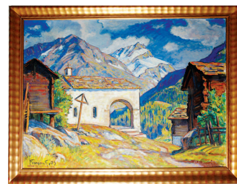
François Gos - Blatten - Huile - Dimensions 79 cm sur 109 cm