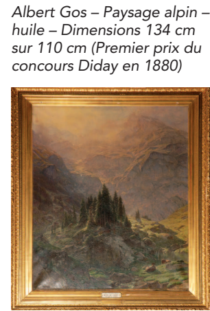
Albert Gos - Paysage alpin - huile - Dimensions 134 cm sur 110 cm (Premier prix du concours Diday en 1880)