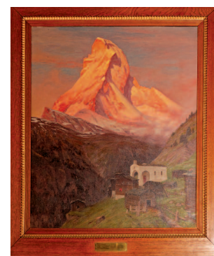
Albert Gos - Le Cervin - Huile - Dimensions 81 cm sur 74 cm

Texte: Jacques Auroy et Maéva Besse (historienne de l'art - organisatrice de l'exposition)