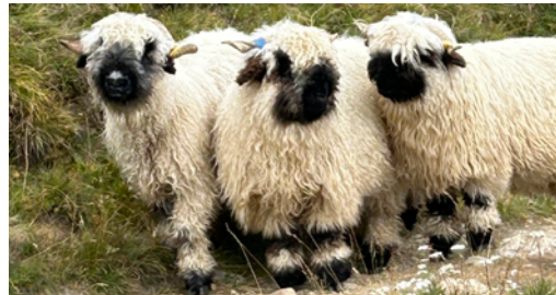
Trois moutons à nez noir