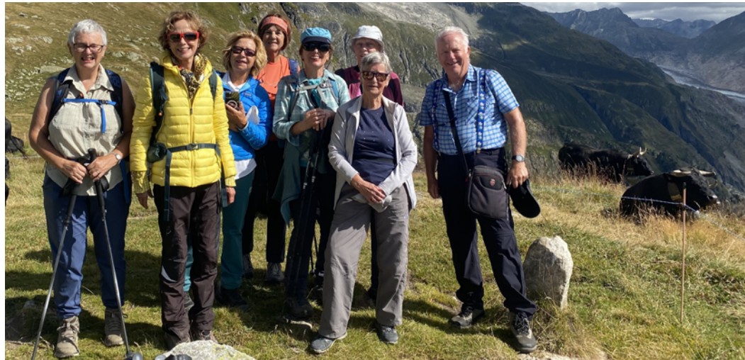
Au mémorial Tyndall