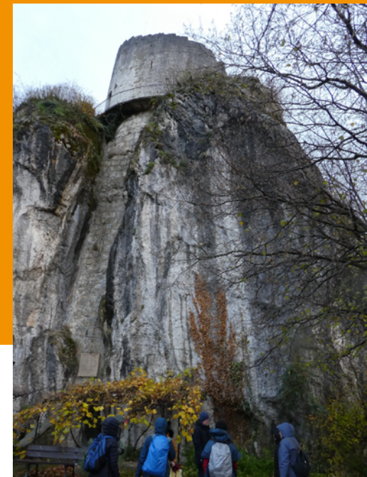
La tour des Comtes de Genève