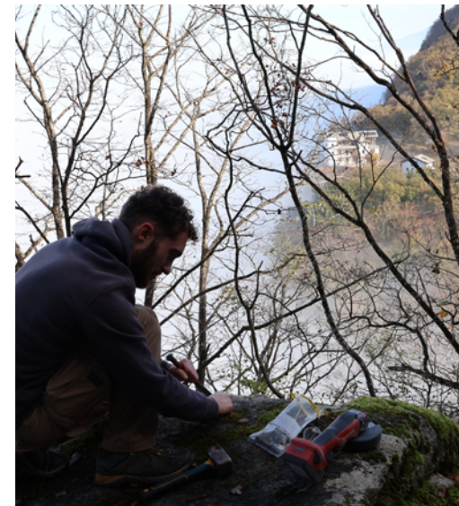
Prélèvement sur la pierre à Trottet

C'est une méthode nommée « datation par isotopes cosmogéniques », qui est utilisée depuis quelques années notamment en géomorphologie glaciaire. C'est pourquoi un des premiers objectifs de sa thèse a été d'échantillonner 23 blocs erratiques d'origine cristalline dans la vallée de l'Arve, au Salève et dans le Bas-Chablais. Ces datations, couplées avec l'étude (sur le terrain et via des outils numériques) de la géomorphologie de la région, devraient permettre de mieux connaître la chronologie et la vitesse de la déglaciation dans cette région.