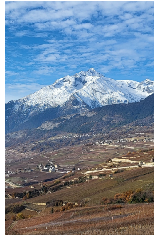
Le vignoble en hiver et le Haut-de-Cry