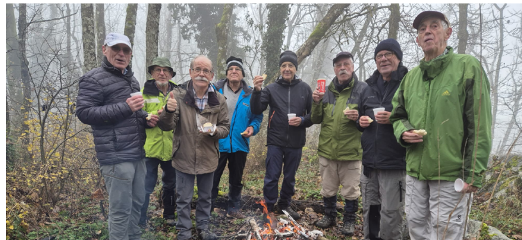
Groupes A et B presque au complet