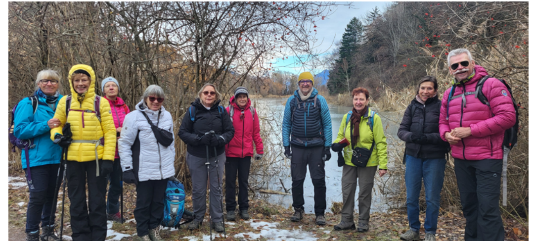
Le groupe au lac de Mont d'Orge