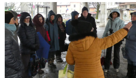
Notre guide nous accueille