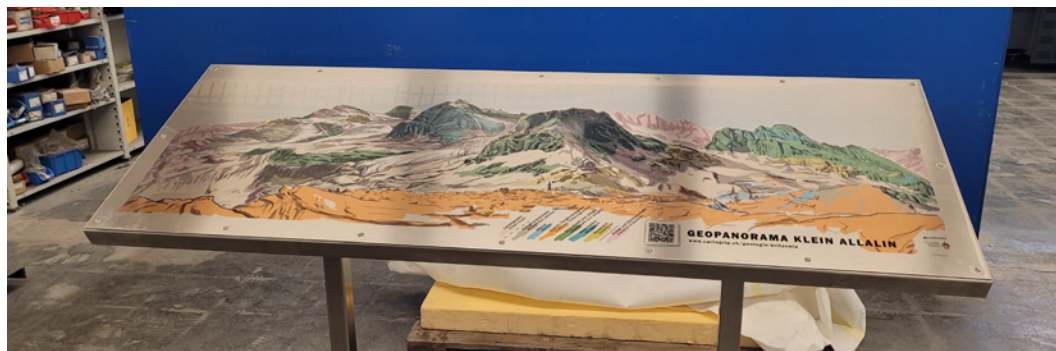
Le géopanorama à sa sortie d'usine